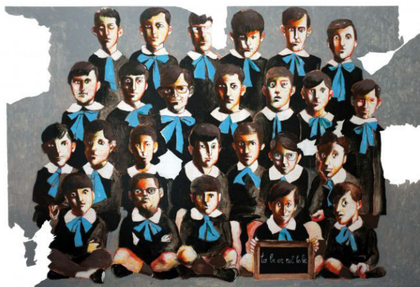
S. Leta, «TOBEORNOTTOBE 6», acrilico su tela cm 50X70

Esistono diverse manifestazioni di processi di intelligenza collettiva in rete: quello più celebre – e senza dubbio compatibile con le forme dei social media – è Wikipedia. La più grande enciclopedia collaborativa del mondo è la rappresentazione più evidente di una forma di intelligenza collettiva in quanto è in grado di produrre contenuti informativi piuttosto attendibili (secondo la maggior parte delle ricerche). Questa sua qualità è frutto delle tre proprietà di cui abbiamo detto sopra: collaborazione, una partecipazione essenzialmente volontaria basata sull'imperativo etico espresso dall'acronimo NPOV ( neutral point of view , punto di vista neutrale), coordinamento, fondato sul rapporto fra membri giovani della piattaforma e membri anziani e discussioni sull'affidabilità delle voci basata sulla discussione nelle zone di confronto della piattaforma, e infine tecnologia, ovvero un sistema tecnico che consenta lo svolgersi delle attività sociali necessarie al mantenimento del progetto che nel caso di Wikipedia è