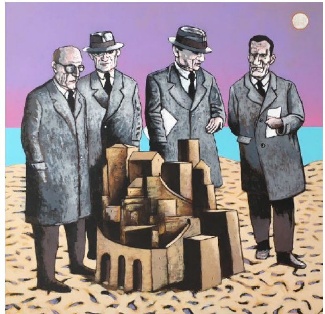
S. Leta, «Il castello 5», acrilico su MDF, cm 60x60

pop. Emblematico in questo senso la spoiler culture di trasmissioni televisive come Survivor . Survivor è un reality televisivo basato su un meccanismo di gioco di sopravvivenza ambientato in luoghi esotici e selvaggi puntellato da una serie di prove da superare che un gruppo di concorrenti – detti naufraghi – devono compiere nel corso della