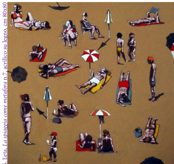
S. Ieta, La spiaggia come metafora n.7, acrilico su legno, cm 80x80

la percezione che la società condivida il loro stesso punto di vista. In pratica il meccanismo dipende da due fattori: le opinioni che le persone posseggono e la percezione della società intorno a loro.