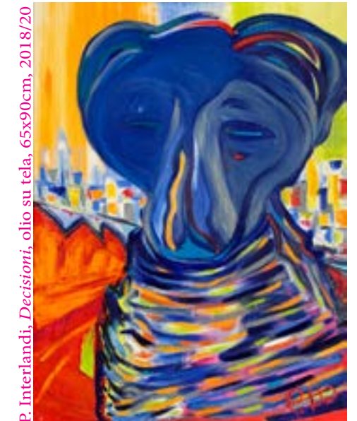
P. Interlandi, Decisioni, olio su tela, 65x90cm, 2018/20

Arriviamo così alle questioni di fondo di Animalia . Il limite come condizione necessaria di ogni forma d'esistenza. L'umano come specie tesa a sfondare il proprio limite finché non comprende pienamente se stessa. Il rapporto con